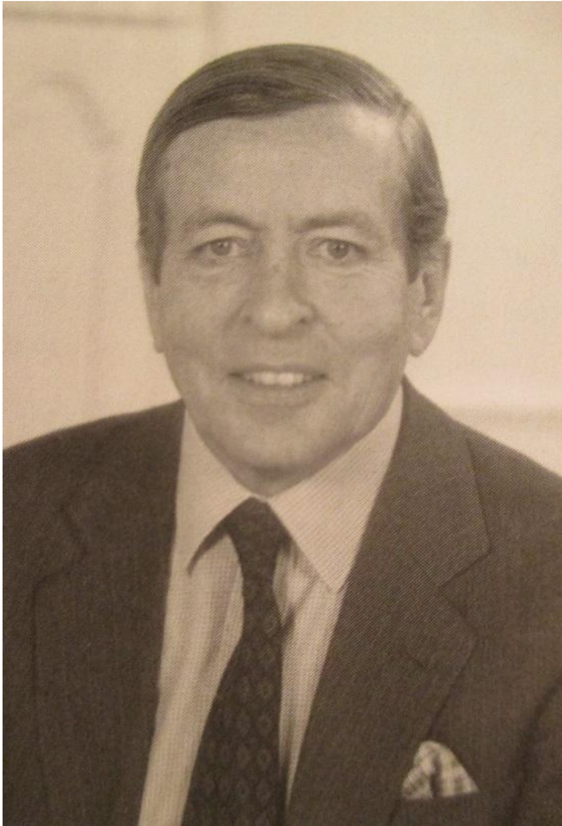
Claus von Amsberg, 6.9.1926 – 6.10.2002, Diplomat, Prinz der Niederlande und Gemahl der Königin Beatrix, Vater von König Willem-Alexander

Des Rätsels Lösung aus dem Bürgerbrief 87: